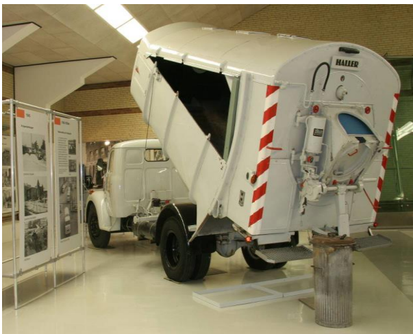
Fahrzeugtyp: Schneckenmüllwagen Baujahr: 1955 Fahrgestell: Magirus-Deutz K 4500 Aufbau: Fahrzeugbau Haller Zusatzinfo: Fahrbereit*