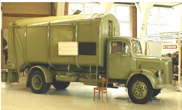
Fahrzeugtyp: Schneckenmüllwagen Baujahr: 1956 Fahrgestell: Mercedes-Benz L 311 / 42 Aufbau: Haller Zusatzinfo: Fahrbereit*