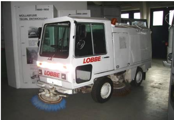
Fahrzeugtyp: Kleinkehrmaschine Baujahr: 1988 Hersteller: Schörling BKF W Zusatzinfo: Fahrbereit*