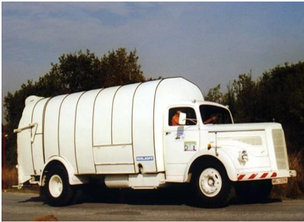
Fahrzeugtyp: Drehtrommelmüllwagen Baujahr: 1954 Fahrgestell: Mercedes-Benz L 6600 M Aufbau: KUKA Zusatzinfo: Fahrbereit*