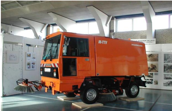
Fahrzeugtyp: Kleinkehrmaschine Baujahr: 1987 Hersteller: Schörling M-TTV Zusatzinfo: Fahrbereit*